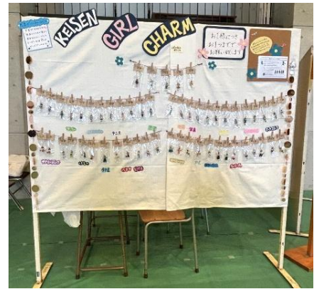
恵泉デーでの販売品(2024年)