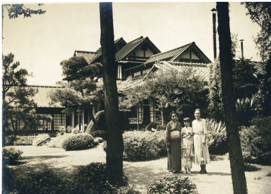
一色百合、一色義子、河井道（一色邸にて 1935 年頃か）